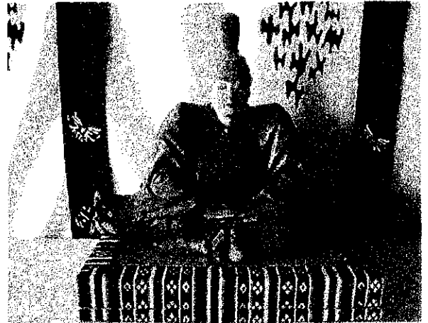
※ 日吉神社に伝わる御戸開天満天神像 ～天神様～ 菅原道真は学問・出世の神様として親しまれています

平成20年5月、 さかしだに ひよし 逆谷の日吉神社 で発見された、直江兼続公が奉納 したと伝えられる天神像(木像)*に あやかり、受験生の合格と健勝を 願い、本年も下記のとおり合格 祈願祭を開催いたします。