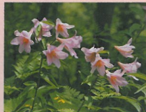
雪国植物園(ヒメサユリ)