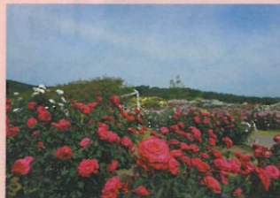
国営越後丘陵公園(バラ)

雪国越後の里山をそのまま利用し、自然生態系を大切に造り上げた植物園です。ヒメサユリおよそ1万本が見頃を迎え、春の山野草展示即売会も実施しています。