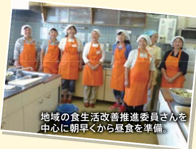
地域の食生活改善推進委員会を中心に朝早くから昼食を準備。