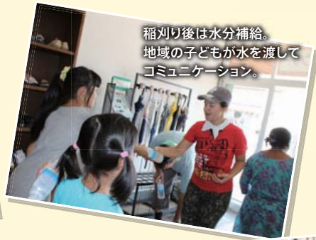
稲刈り後は水分補給。地域の子どもが水を渡してコミュニケーション。