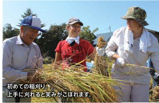
初めての稲刈り。上手に刈れると笑みがこぼれます。

そのため、今年は初心に帰り、王寺川の子どもたちに国際交流の楽しさを味わってもらおうと「スポーツ鬼ごっこ」と「世界のフォークダンス」を取り入れました。