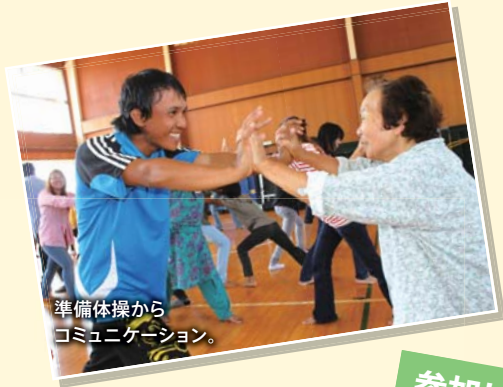
準備体操からコミュニケーション。