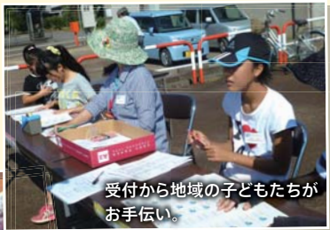
受付から地域の子どもたちがお手伝い。