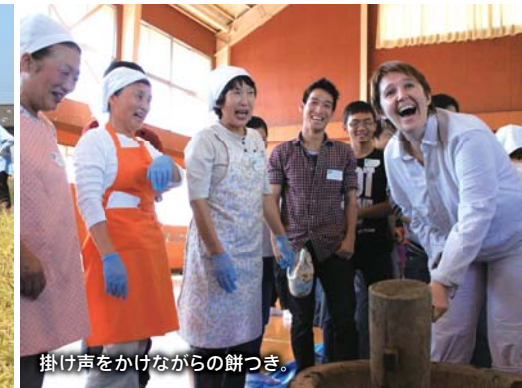
掛け声をかけながらの餅つき。