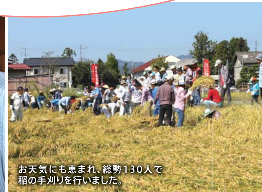
お天気にも恵まれ、総勢130人で稲の手刈りを行いました。