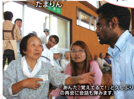
「あんだ、覚えてるで!」と久しぶりの再会に会話も弾みます。