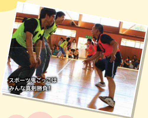
スポーツ鬼ごっこはみんな真剣勝負!