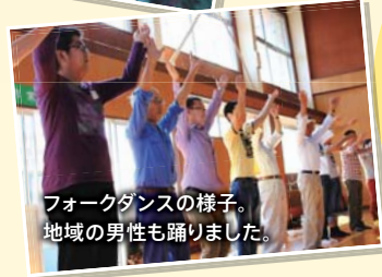
フォークダンスの様子。地域の男性も踊りました。

昨年も参加して楽しかったので、友達と一緒にまた来ました。今年は昨年と違い、鬼ごっこで子どもと一緒に遊べたのが楽しかったです。