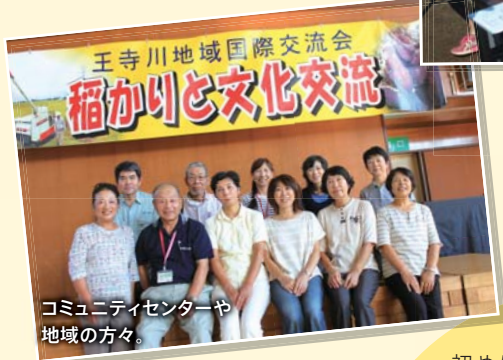
王寺川地域国際交流会 稲刈りと文化交流