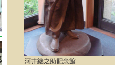
河井継之助記念館