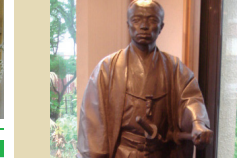
河井継之助記念館