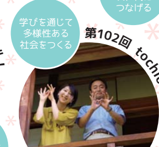
第102回 tochiho (とちほ)