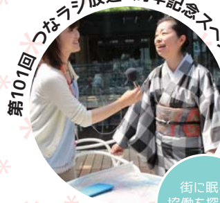
第101回 つながるラジオ放送2周年記念スペシャル!