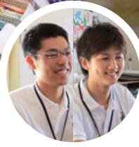
現在スタッフ13名 若手も活躍しています

知的・発達障がいがあり、総合支援学校や支援クラスに通う子どもたちの、放課後の活動の場を提供しています。NPO法人ならではの自由な発想で、子どもたちがのびのびと身体を動かす歌やダンス・楽器演奏、食育への理解と自分でつくる喜びを生み出すキッズファームプロジェクトを運営。各種イベントへお店屋さんとして出店するなど、社会参加や生きる力につながるようなプログラムを行っています。子どもたちの活動を支えてくれるボランティアを募集中です。