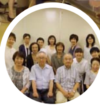
現在26名の メンバーが活躍中

要約筆記は私達が普通にしている音声コミュニケーションを、その場で文字にして伝える技術です。難聴者や中途失聴者の「会話の変換役」として活動を始め21年目。平成14年からはパソコンでの要約も加わり、打合せや講演での文字での通訳。役所での手続きや、病院の診察の際に同席したりと、様々な場面で活躍しています。毎月2回定例学習会を開催し、中途失聴者を含めた全員で意見を交わしながら、正確な要約と筆記の技術を磨いています。