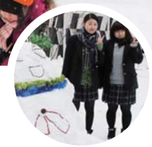
雪像づくりは地域とつながる場です

昭和61年開催の「長岡100だるま大会」をルーツに持つ「雪しか祭り」。ハイバ長岡を中心に雪を楽しむイベントが実施されます。アオーレ長岡では、ソトドマを会場にユニークな雪像が登場。手掛けるのは葵高等学校の皆さん。マンガコースの生徒が中心となって設計図を書き、学年を越えた有志が基で話題のキャラクター雪像を作り、まちなかでお祭りを盛り上げます。足を止める市民の方も多く、宣伝に一役買っています。「今回も楽しみにしていてほしい」と意欲満々です!