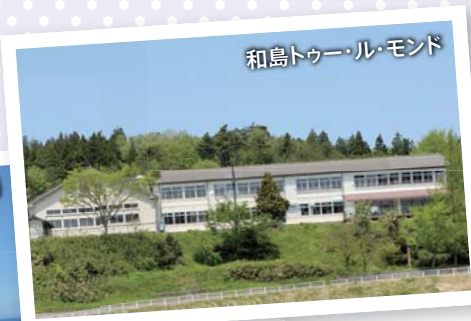
和島ツアー・モンド