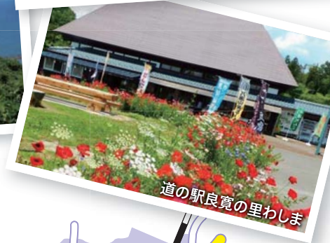
道の駅良寛の里わしま