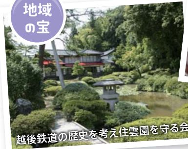
越後鉄道の歴史を考え住雲園を守る会