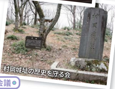
村岡城址の歴史を守る会