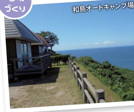
和島オートキャンプ場