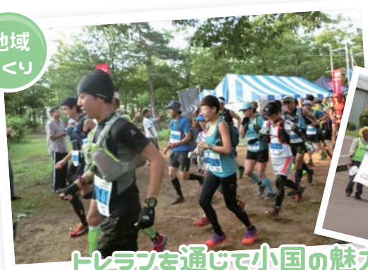
トレランを通じて小国の魅力発信!