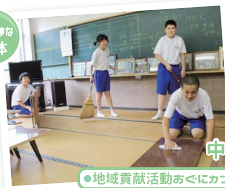
● 地域貢献活動おぐにカンパニー (小国中学校) ●

中越地震をきっかけに、中学生でも何か地域に貢献できることはないかと平成17年に開始。住民や企業から清掃や企画などの依頼を募集し、全校生徒が運営・技術・企画・制作の4部門に分かれて対応します。平成27年には「時事通信社 教育奨励賞 優秀賞および文部科学大臣賞」を受賞。活動を通して、地域産業や地域の宝を知り、小国を誇りに思いながら成長できる貴重な学びの機会になっています。