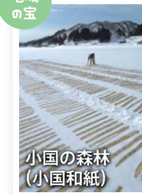
小国の森林 (小国和紙)