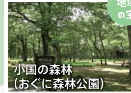
小国の森林 (おぐに森林公園)