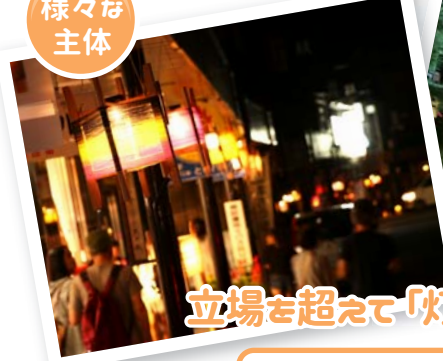
ランプまつりと栃尾商店街