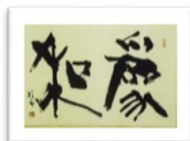
青山杉雨 「篆書 和為」

4月1日(土)~5月21日(日) 近代で活躍した文化勲章や文化功労章を受章した書家の作品と良寛研究家の書を展示し、見る人を魅了する良寛書と比較鑑賞できる展示です。 ・良寛 ・村上三島・青山杉雨・古谷蒼韻 ・成瀬映山 ほか