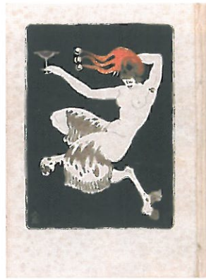
『抒情小曲 月夜の園』初版 玄文社詩歌部 (1922年)