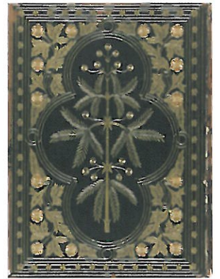
『堀口大學詩集』初版 第一書房 (1928年)

長岡市立図書館は、平成30年に開館100周年を迎えます。そのプレイベントとして、所蔵する貴重資料等を紹介する「詩人 堀口大學と長岡」展を開催いたします。