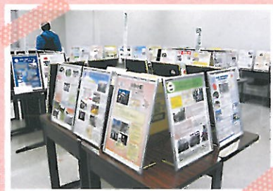
悠久祭でのパネル展示