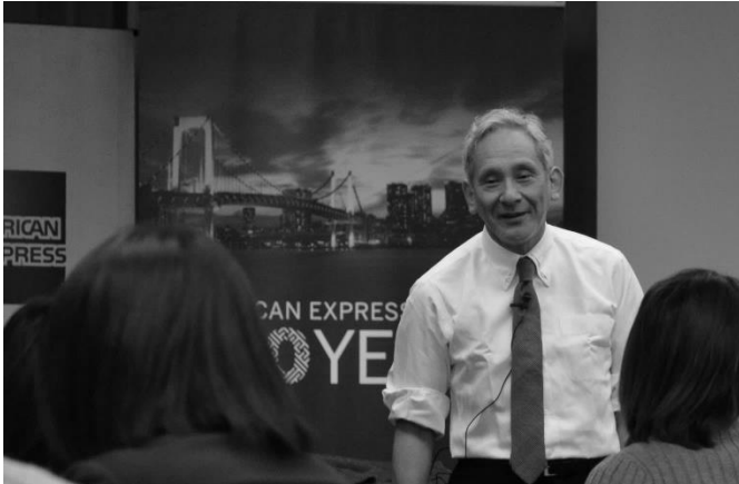
総合監修・米倉誠一郎先生による基礎講座