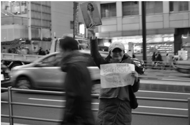
フィールドワーク 「道端留学：ビッグイシュー販売サポート」