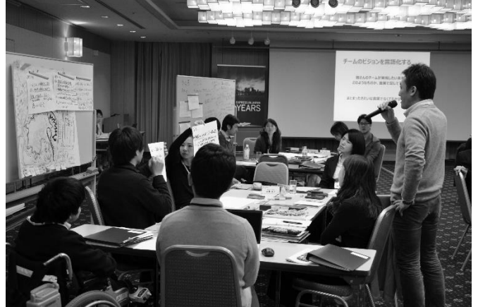
グループ・ディスカッション