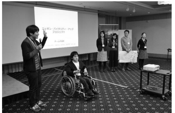
最終日の課題発表プレゼンテーション