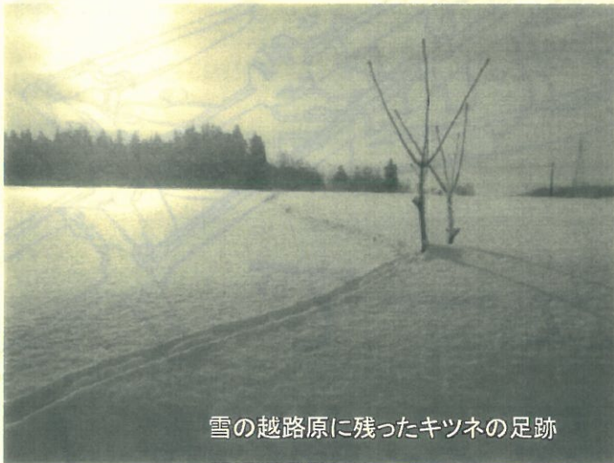
雪の越路原に残ったキツネの足跡