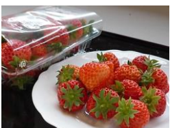
寺治産・越後姫・完熟朝採り