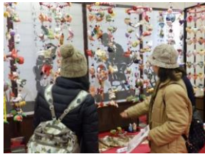
スタンプラリーA賞景品 這い子人形セット