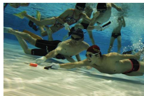
ニュースポーツの推進に (新潟で水中ホッケーを推進する会)