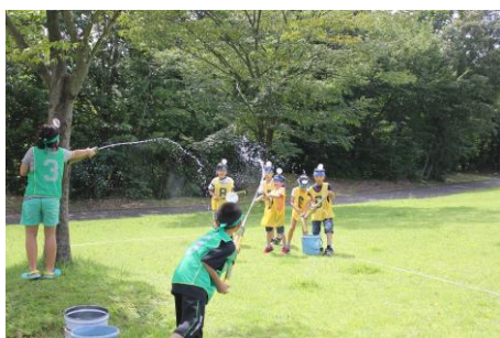
ものづくりと思い出づくりの体験活動 (ATC-アルプス電気卓球クラブ-)

併せて『 ながおか市民協働センター 』が企画から実施までのきめ細かいサポートを行います。