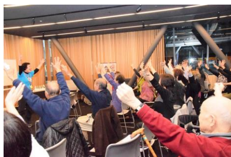
認知症予防で広げる人の輪 (福祉のおとのわ)