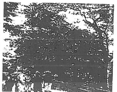
9月ハイキング(高尾山)