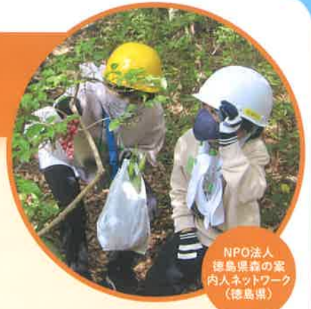
NPO法人 徳島県森の家 内人ネットワーク (徳島県)

自然環境保護や生物多様性の保全、気候変動対策、脱炭素化をめざす取り組みなど、市民が主体となって行う環境活動を1年間支援します。