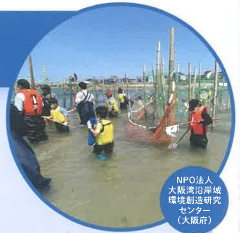
NPO法人 大阪湾沿岸域 環境創造研究 センター (大阪府)

持続可能な活動を実現する自主事業の構築・確立をめざすNPO法人に対し、事業資金・常勤専従職員の人件費・事務所家賃を原則3年間支援します。