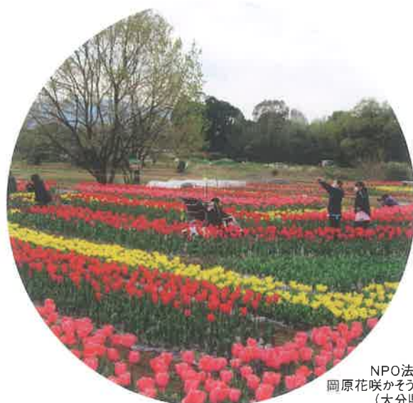
NPO法人 岡原花咲かそう会 (大分県)