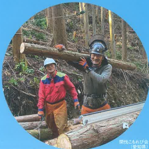
岡代こもれび会 (愛知県)