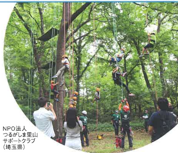
NPO法人 つるがしま里山 サポートクラブ (埼玉県)

A 少なくとも、助成期間の使用許可書と承諾書が必要です。2023年度の助成には、2023年4月1日～2024年3月31日の期間が必要です。使用契約が複数年の場合、有効期限切れのないようご注意ください。海での活動については、内容により漁業組合等の許可が必要な場合があります。