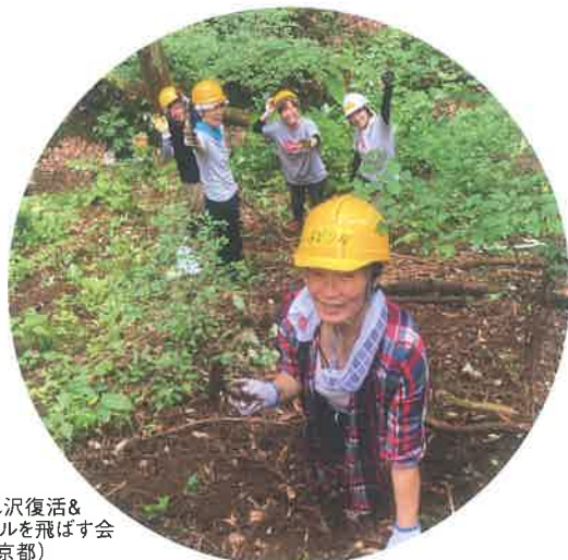
枯れ沢復活& ホタルを飛ばす会 (東京都)