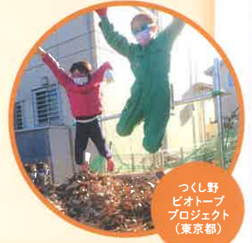
つくし野 ビオトープ プロジェクト (東京都)