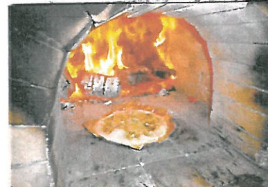
④ 本格石窯ピザがどっさり。