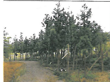
③ 雪が融けて…残念な杉林。