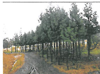
② 雪の降る前の美しい杉林。