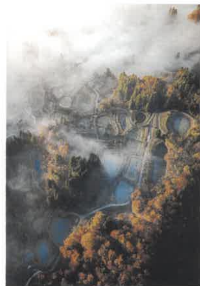
第38回 特別賞・長岡商工会議所会頭賞／大村博明氏 作品