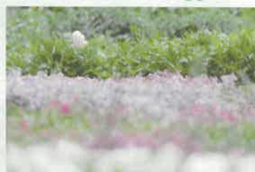
第38回 小太郎賞 / あやなん氏 作品