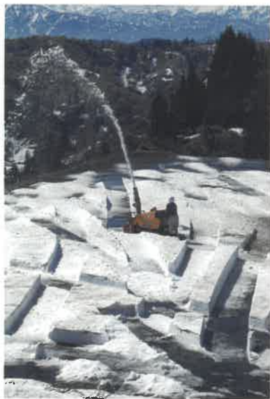
第38回 特選・毎日グランプリ／神田明彦氏 作品