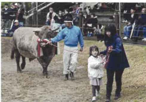
第38回 入選・新潟フジカラー賞／星正太郎氏 作品