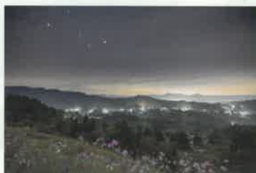
第38回 山古志住民会議賞 / Z_lupi_1984 氏 作品