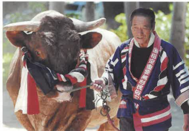
第38回 春の部 新潟県毎日会賞 / 刈谷直行氏 作品