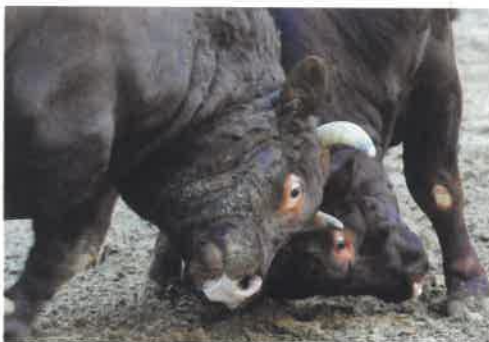
第38回 秋の部・スポーツニッポン新聞社賞／大竹俊夫氏 作品