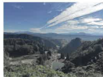
第38回 小太郎賞／RYU氏 作品